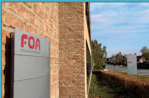
Medlemsarrangementer Side 10