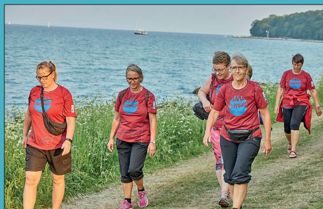
Ladywalk 2019 Side 11